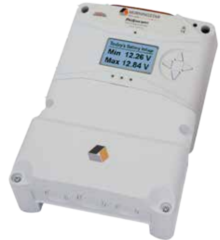
Disponibles con medidor y caja de cables opcional